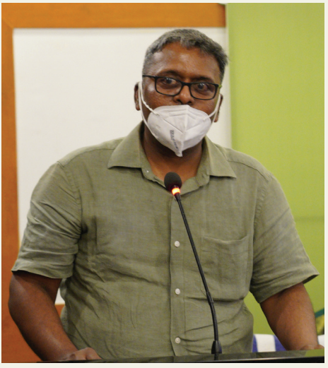
ഡോ. രാജൻ ചോബ്രഗഡെ ഐ.എ.എസ്