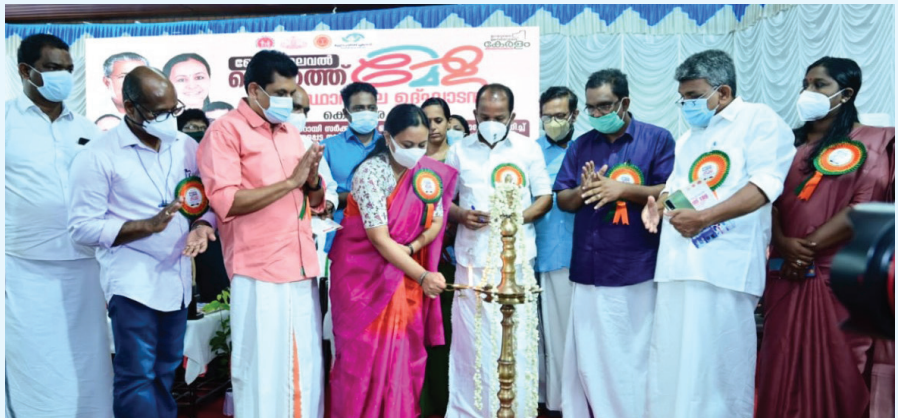
ആരോഗ്യമേള ആരോഗ്യമന്ത്രി വീണ ജോർജ്ജ് ഉദ്ഘാടനം ചെയ്യുന്നു. (വാർത്ത 2-ാം പേജിൽ)