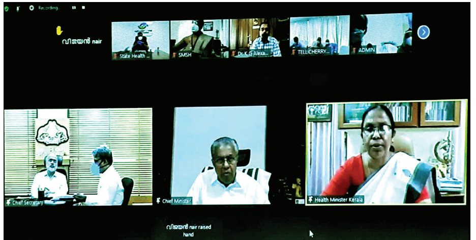
കോവിഡ് രണ്ടാം തരംഗം അതിജീവന തന്ത്രങ്ങൾ രൂപപ്പെടുത്തുന്നതിനായ് സ്വകാര്യ ആശുപത്രി മാനേജ്മെന്റ് പ്രതിനിധികളുമായി സർക്കാർ നടത്തിയ ഓൺലൈൻ കൂടിയാലോചനയിൽ മുഖ്യമന്ത്രി പിണറായി വിജയൻ സംസാരിക്കുന്നു.

പദ്ധതിയിൽ അംഗമായ ആശുപത്രികളിൽ അനവധി തൊഴിലവസരങ്ങളും സൃഷ്ടിക്കപ്പെട്ടു. നിലവിൽ അംഗങ്ങളായ 735 ആശുപത്രികളിലായി രണ്ടായിരത്തോളം മെഡിക്കൽ കോർഡിനേറ്റർമാർ പ്രവർത്തിച്ചുവരുന്നു.