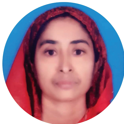
അപ്പോഴാണ് സഹോദരിക്ക് ആർ.എസ്.ബി.വൈ ഇൻഷുറൻസുള്ള വിവരം അറിയുന്നത്.

ഉടൻ ശസ്ത്രക്രിയ വേണം, ലക്ഷങ്ങൾ ചെലവു വരും. വൈകിയാൽ രോഗിയുടെ നില വഷളാകും എന്ന് ഡോക്ടർ പറഞ്ഞപ്പോൾ എല്ലാവരും തളർന്നു.