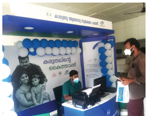
തൃശ്ശൂർ മെഡിക്കൽ കോളേജിൽ പ്രവർത്തനം ആരംഭിച്ച കിയോസ്കിലെ ആരോഗ്യ മിത്ര ഗുണഭോക്താവിന് ആരോഗ്യ ഇൻഷുറൻസ് കാർഡ് നൽകുന്നു.