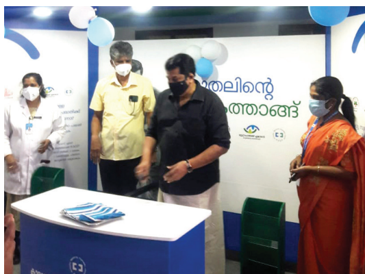
കൊല്ലം ജില്ലാ ആശുപത്രിയിൽ കിയോസ്കിന്റെ പ്രവർത്തനം മുകേഷ് എം.എൽ.എ ഉദ്ഘാടനം ചെയ്യുന്നു